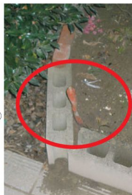
スコップなら、ガラスを割る道具になる

侵入の道具になる 泥棒は、このような家は防犯意識が低く鍵かけが不十分で侵入しやすいと判断する