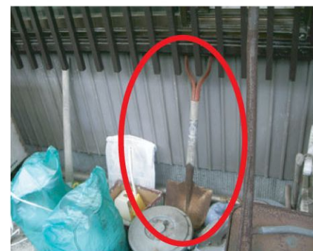
シャベルなら面格子を破壊する道具になる