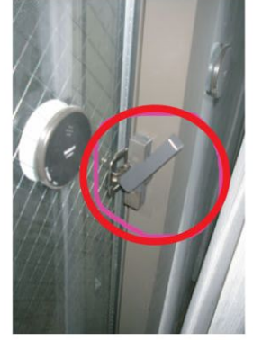
① サッシレセントの ロックをかける